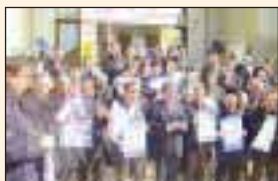
KAYSERİ BASIN AÇIKLAMASI

Karabük şubemizce, şube binamızda yapılan toplantı sonrası bir basın açıklaması gerçekleştirilerek, İçişleri Bakanlığı çalışanlarının sorunları dile getirildi. Vergi haftası nedeniyle şubelerimizden basın açıklamaları İzmir, Edirne, Isparta, Antalya, Mersin, Bolu, Sakarya, Denizli, Konya