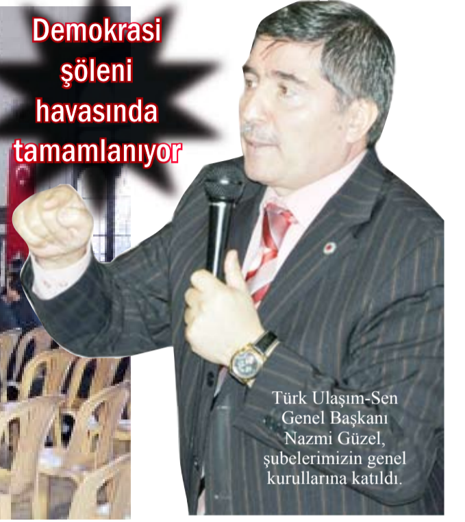
Türk Ulaşım-Sen Genel Başkanı Nazmi Güzel, şubelerimizin genel kurullarına katıldı.

09 Ekim 2010 tarihinde İzmir-2 No'lu Şube Başkanlığı'nın 4. Olağan Genel Kurulu Adnan Menderes Havalimanında, 10 Ekim 2010 tarihinde ise İzmir-1 No'lu Şube Başkanlığı'nın 4. Olağan Genel Kurulu TCDD Alsancak Sosyal Tesislerinde gerçekleştirildi.