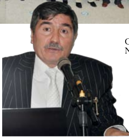
Genel Başkan Nazmi Güzel, "Türkiye Kamu-Sen Gerçeği, Tarihi, Misyonu ve Vizyonu" konulu bir sunum yaptı.

Kurumun yanlıştan ısrarını sürdürmesi durumunda konuların yargıya taşınacağı deklere edilmiş ve biran evvel bu atamalardan vazgeçilerek kişilerin hak ettikleri kendi kadrolarına döndürülmesi talebinde bulunulmuştur.